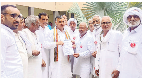
जीद। ज्ञान सौंपते किसान नेता।