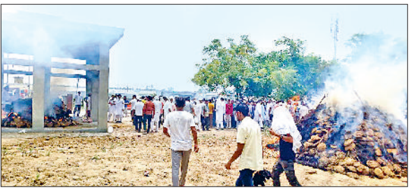
पूंडरी। मोहना में दोनों युवकों की अंतिम यात्रा में मौजूद लोग।