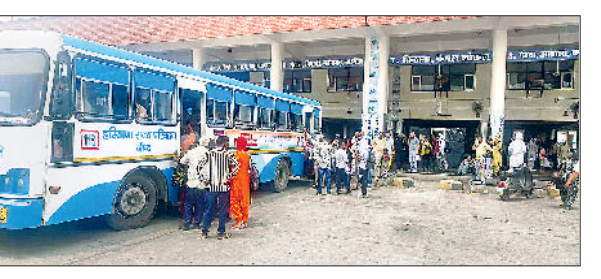
जाँद। बसों में सीट हासिल करने के लिए चढ़ते यात्री।

केंद्रीय गृह मंत्री अमित शाह के महेंद्रगढ़ में कार्यक्रम को लेकर जाँद डिपो से 33 रोडवेज बसों को विभिन्न गांवों से लोगों को लेकर गई थी। जाँद बस अड्डे पर परिवहन व्यवस्था प्रभावित हुए। लोकल रूटों पर यात्रियों को समय पर बसें नहीं मिली। जिस कारण उन्हें निजी वाहनों का सहारा लेकर अपने गंतव्य तक पहुंचना पड़ा। जाँद डिपो के बेड़े में 200 बसें हैं। जिनमें