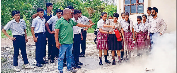
जीद। अग्नि सुरक्षा के बारे में जानकारी हासिल करते बच्चे।