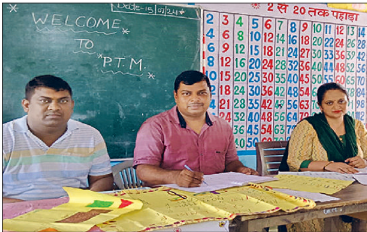
जीद। पीटीएम में भाग लेते हुए अभिभावक व अध्यापक।