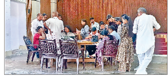
कैथल। आरकेएसडी कालेज में दाखिला लेते विद्यार्थी।