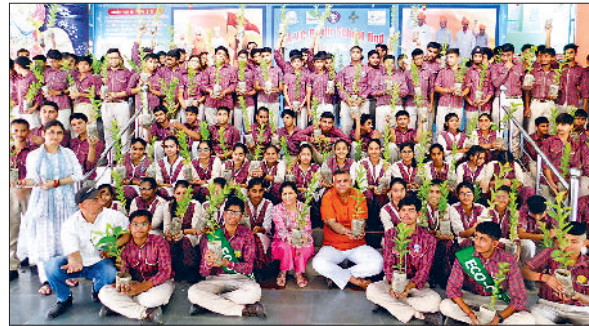
जीद। कार्यक्रम में मौजूद प्राचार्या।