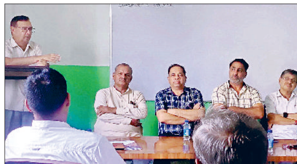
जीद। बैठक में भाग लेते निजी स्कूलों के अध्यापक।